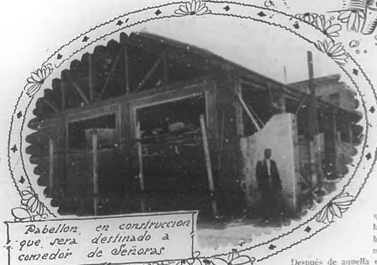
Pabellón en construcción que será destinado a comedor de señoras

Abandonamos aquel triste asilo, con la más dolorosa impresión, tornábamos a la capital a pisar sus calles bellas y bulliciosas, y contemplar rostros de mujeres lindas y elegantes y de hombres en cuyos rostros se adivinan rasgos de felicidad completa, en tanto, que en nuestra mente aún brillan los más piadosos recuerdos de aquellos a quien la suerte caprichosa ha negado para siempre sus favores, y aún en la Redacción, transcribiendo nuestras dolorosas impresiones de nuestra visita a Mazorra, recordamos el lastimero adiós de una loca viejecita que nos dijo: "Adiós y suerte."