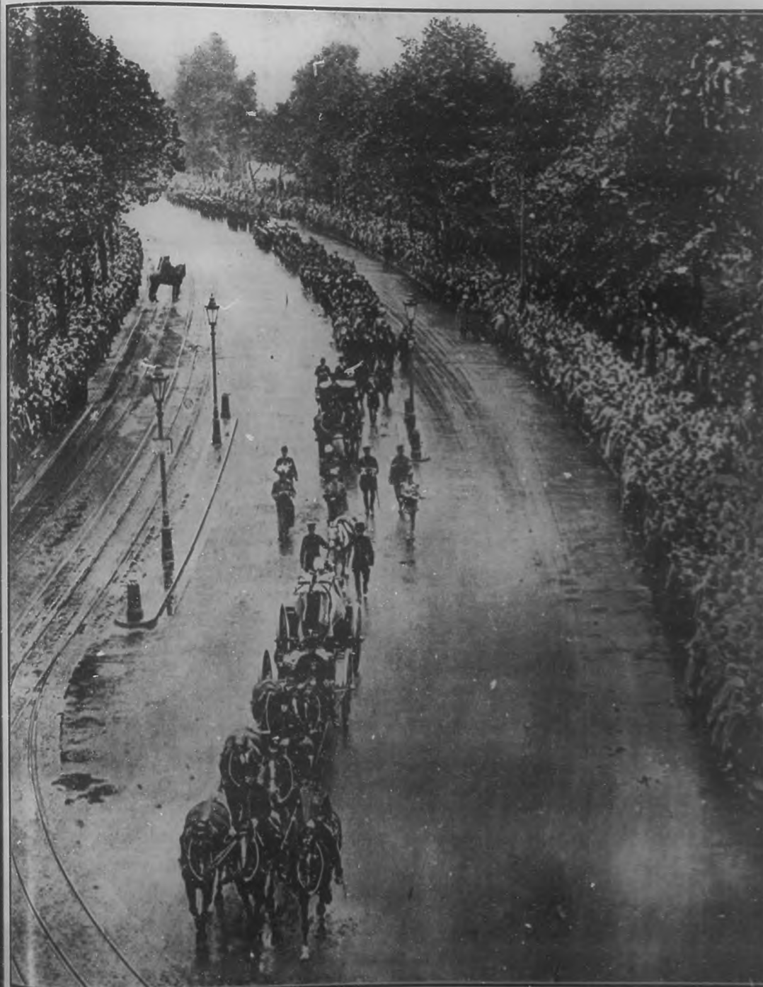
Una vista del entierro del mariscal de campo inglés Sir Henry Wilson, recientemente asesinado, en los momentos en que entraba en el Puente de Waterloo, en Londres.

Redacción, Administración y Talleres: Edición de BOHEMIA, Trocadero número 80, 82 y 84. Teléfonos: Dirección M-1322; Administración, A-3658.