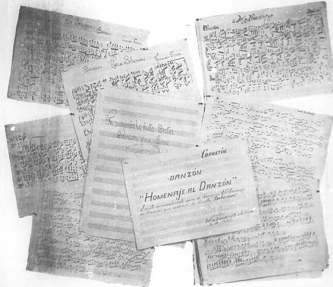
Facsimiles de las portadas de algunos de los danzones que han sido enviados por los autores que se han decidido a tomar parte en el concurso patrocinado por BOHEMIA, que tan favorable acogida ha tenido entre todas nuestras clases sociales.

A esta conferencia asistieron distinguidas personalidades de las cuales