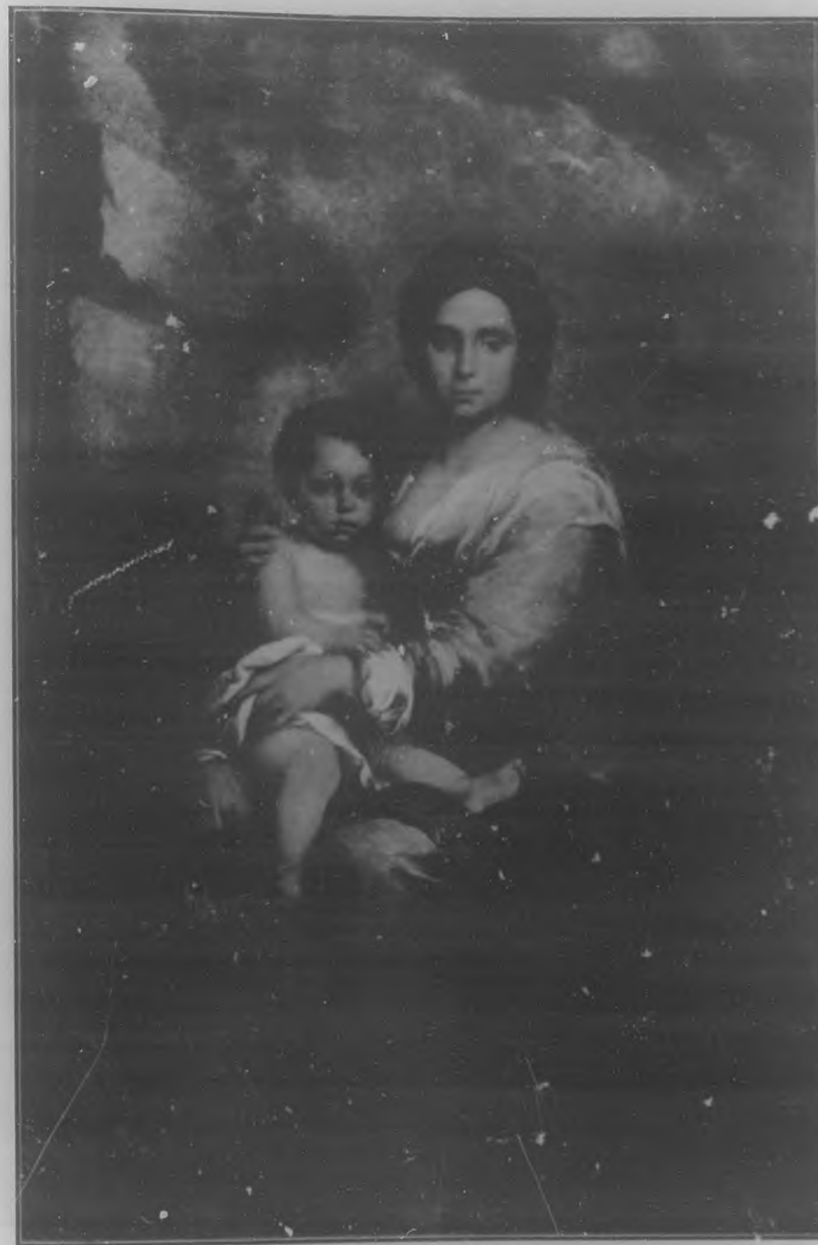
LA MADONNA DEL NIÑO Célebre cuadro de Murillo.