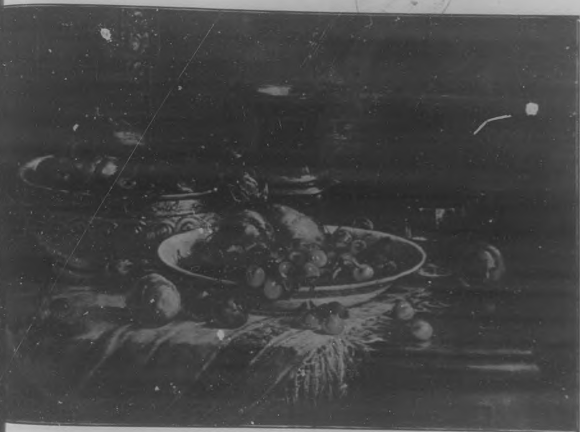
PARA LA MERIENDA Cuadro de J. Scott.